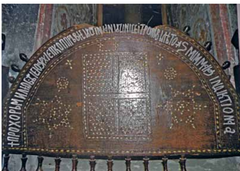
сл. 9. Архиепскојски ѿрон најѿис, калк