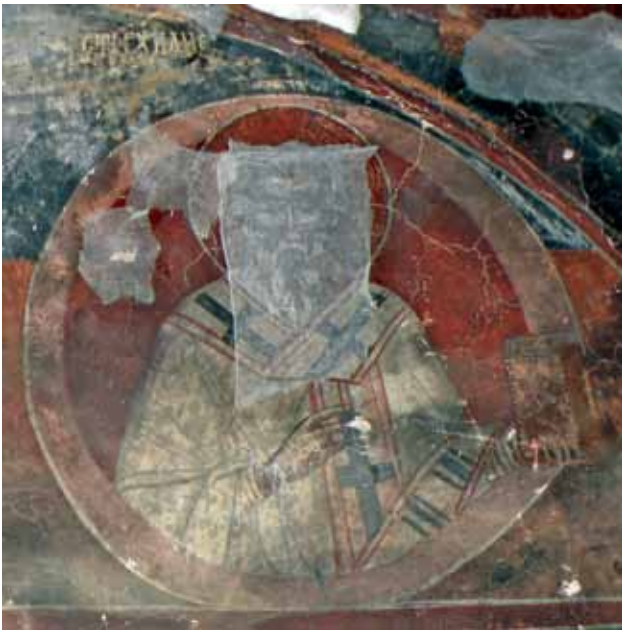
сл. 4. Св. Ахилиј Лариски