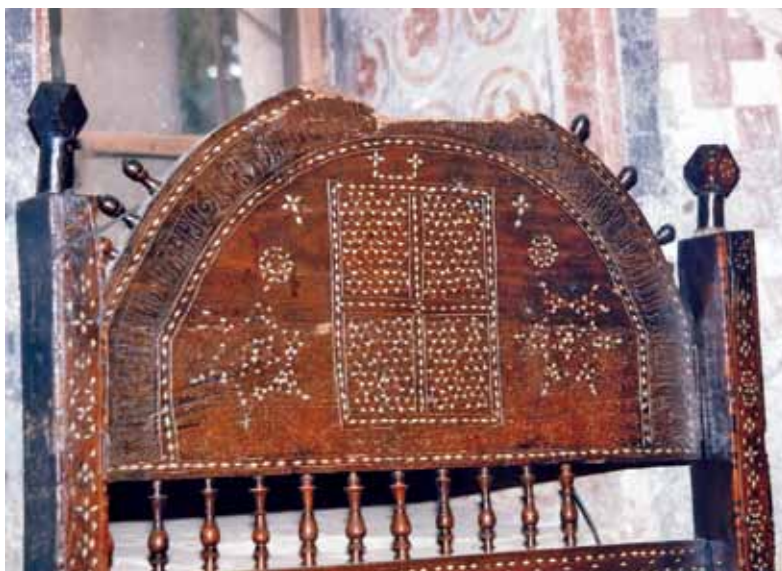
сл. 8. Архиепскојски ѿрон, најѿис