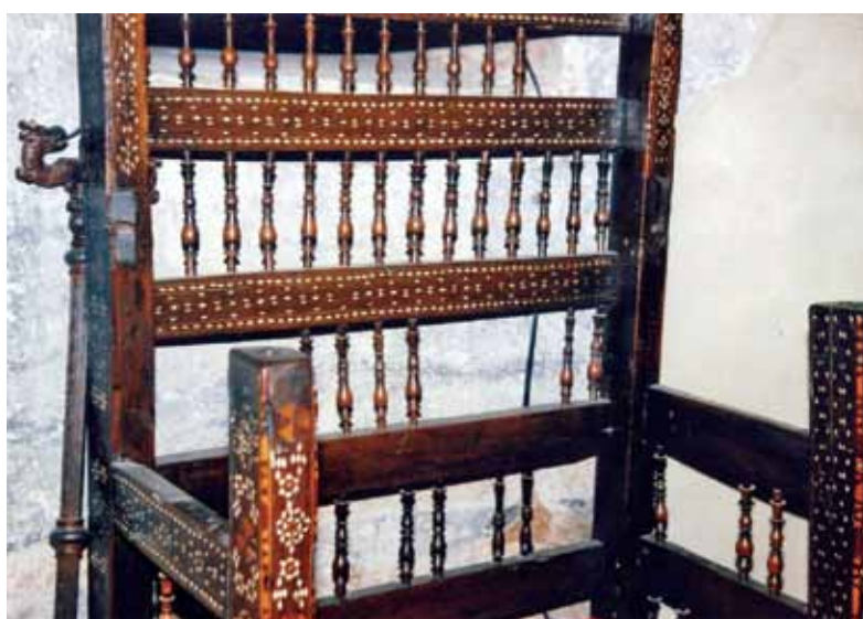
сл. 11. Архиепскојскиоѿ ѿрон _деѿиал