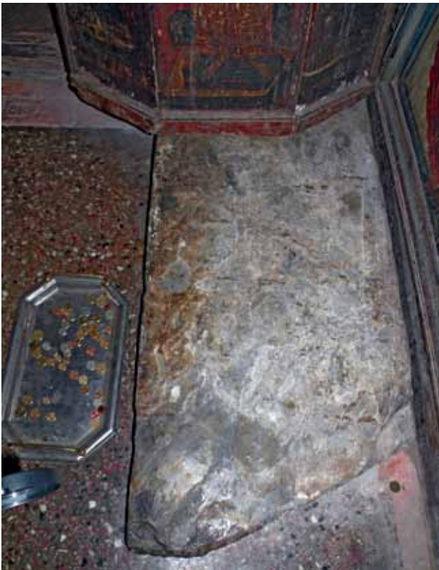
сл. 13. Надгробна плоча на архиепископ Прохор

Многу е важно што во овие две извонредни дела на охридскиот архиепископ Прохор е постојаното повикување на традицијата на Јустинијана Прва, која за него е многу важна и за чиј примат се бори за време на целото архиепископување (1523–1550). Несомнено дека овие обемни и исклучително вредни дела, као и неговата борба за легитимните права на Охридската архиепископија, оставиле силен впечаток и длабоки траги во севкупниот живот на Охрид и неговите современици кои најверојатно, многу брзо по неговата смрт во 1550 година (сл.13) кога споменот за него бил се уште жив го сликаат во црквата Св. Ѓорѓи, с.Врбјани. Во оваа пригода би ги споменале и двата извонредни споменика – триптиси, Слеченскиот 19 и оној од црквата Св. Богородица Перивлепта (Св. Климент) 20 - Охрид, бидејќи и двата започнуваат со името на охридскиот архиепископ Прохор. Иако Охридскиот архиепископ нема сопствен култ, односно немаме податоци за неговата канонизација, сепак, локалната средина и охридскиот архиепископски врв настојувале споменот за него да не се заборава.