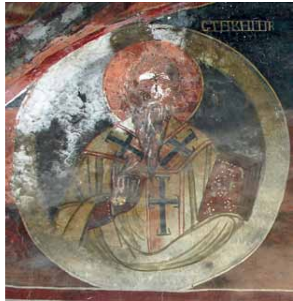
сл. 3. Св. Кирил Солунски