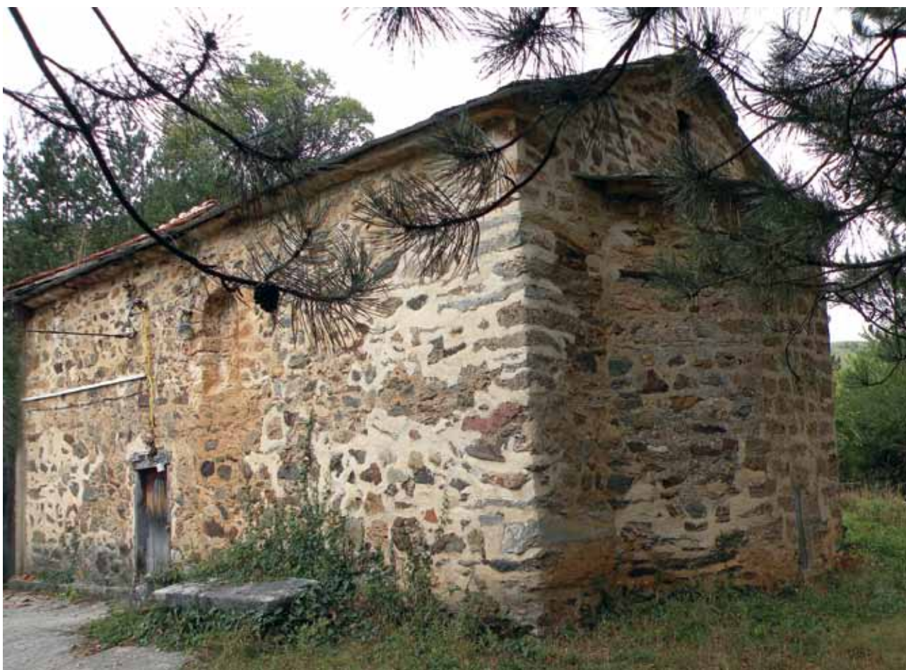
сл. 1. Св. Ѓорѓи во с. Врбјани – Охридско

Пред дваесетина години, објавувајќи го фрескоживописот во црквата Св. Ѓорѓи во с. Врбјани – Охридско 1 , (сл.1) за првпат ја презентиравме сликаната програма каде што посочивме на претставата на св. Прохор, кој подоцна го идентификувавме како портрет на охридскиот архиепископ Прохор 2 .