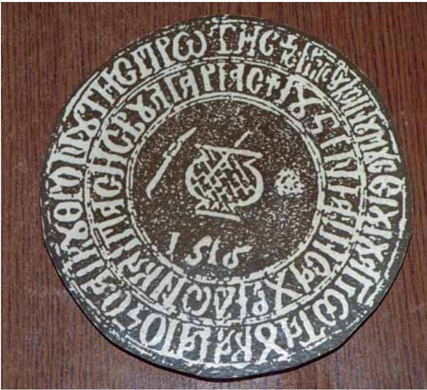
сл. 12. Печат на Охридската Архиепископска библиотека

со геометриски форми како и со украсни елементи од црешово и костеново дрво, изведени на челната страна од тронот, додека токарените колонки водат потекло од Коптите. Сиот трон е украсен со розети, ѕвезди, ромбови и крстови. (сл.11)