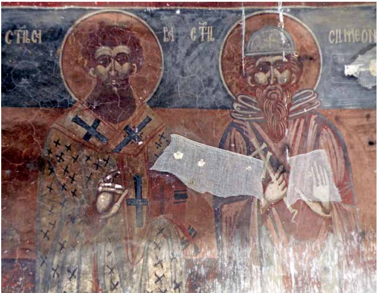
сл. 6. Св. Сава Српски и св. Симеон

ридската средина, за архиепископот Прохор се сочувани повеќе податоци, кои најмногу ја осветлуваат неговата голема активност во сферата на интересите на архиепископијата, но и во сферата на некои суштински работи поврзани со традицијата, словенскиот јазик, книжевноста и уметноста. Како негово ктиторство нам ни се познати неколку дела меѓу кои е најзначаен големиот ктиторски потфат – обнова на трпезаријата на манастирот Дохијар – Света Гора. Прохоровиот ктиторски натпис на фасадата изведен во тула е концепциски сличен на охридската светософиска припрага 11 . Во охридската црква Св. Богородица Перивлепта (Св. Климент) се наоѓа неговиот архиепископски престол (трон) 12 (сл.7) ремек дело на применетата уметност од XVI век. Истиот е од ореово дрво, работен во плиток релјеф и со интарзија. Преку