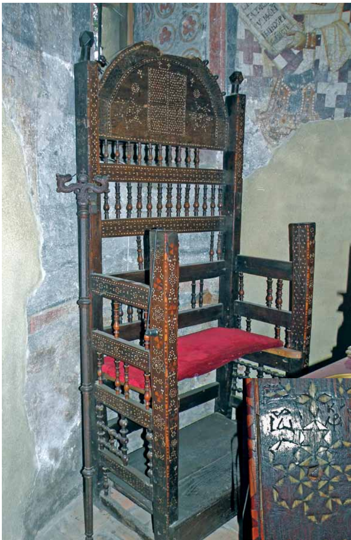
сл. 7. Архиејискојски ѿрон на Прохор