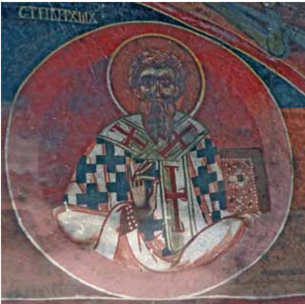
сл. 2. Св. Наум Охридски, архиепископ